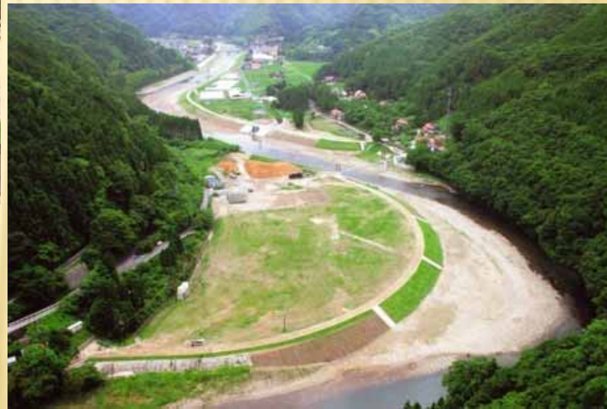
わかあゆの里付近