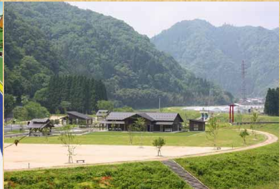
立久恵薬師から望む管理棟