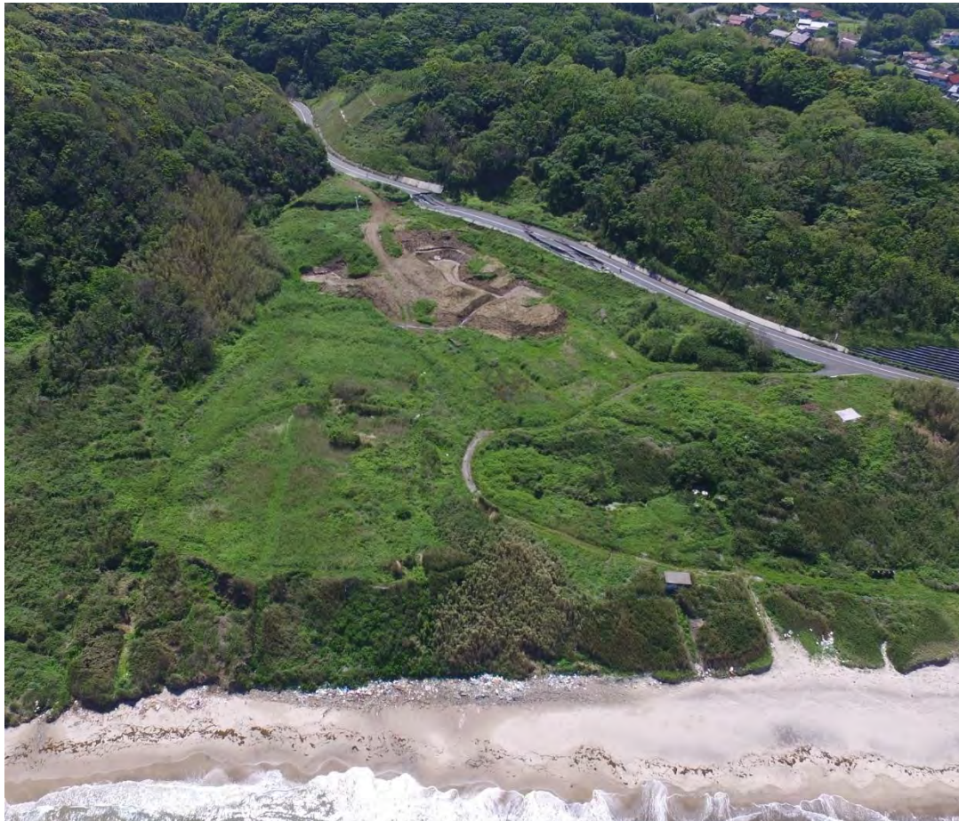
平成27年5月地すべり発生時の写真