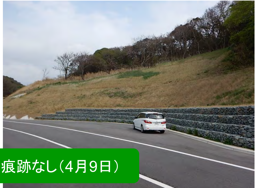
地震による再滑動の痕跡なし(4月9日)